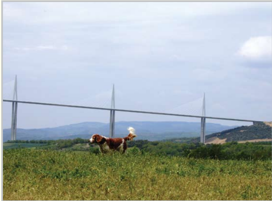
הגשר הגבוה ביותר בעולם נחנך בדיום צרפת בדצמבר 2004. אורכו 2,460 מטרים. גובה עמוד התמך הגבוה ביותר – 343 מטר והוא גבוה ממגדל אייפל.

אל העיר מיו לא נכנסנו. היה שם יישוב רומאי חשוב, ששרידיו עדיין קיימים, ורובע ימי ביניים שהשתמר. יש בעיר מוזיאון שמתעד את המישורים הסלעיים ותהומות הקניונים החורצים אותם. כשתופסים פרספקטיבה על גשר עצום רואים גדול, רואים מרשים. וסמטאות העיר העלומה שמאחור נספגות בתת־מודע כאילו ראינו גם אותן.