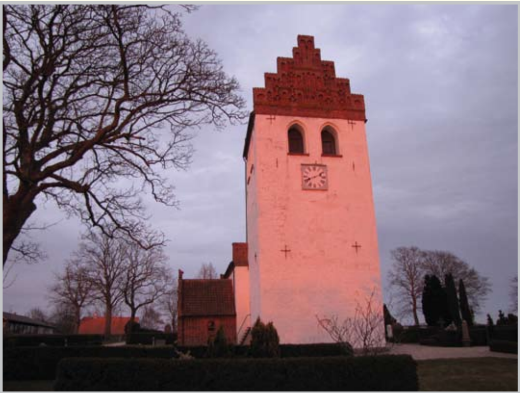
במאה ה־11 הוקמה ביורלונד סדנה לציורי קיר בניצוח אמנים מומחים שהובאו מקונסטנטינופול. הדמויות שעל הקירות אכן לבושות בסגנון מזרחי.

בחוץ שררה כבר חשכה גמורה, ואיגנה אמרה שבעצם אין לה חשק לנקות את הכנסייה הערב. היא הותירה נורה אחת דולקת מעל לדלת הכנסייה ופנינו יחד אל מורד הרחוב.